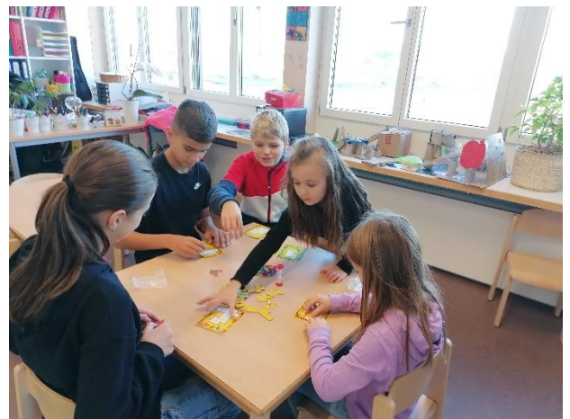
... und beim gemeinsamen Spielen