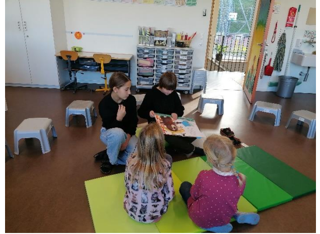
Die Partnerklassen Orange und Rot beim Bücheranschaun, ...

Wir freuen uns schon auf den nächsten Event mit der Partnerklasse.