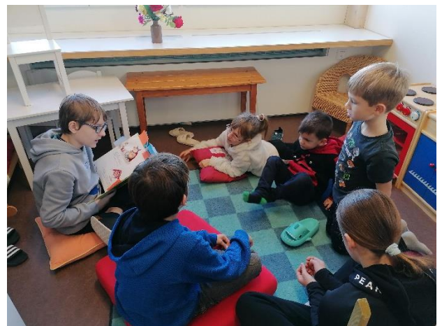
... beim Vorlesen ...