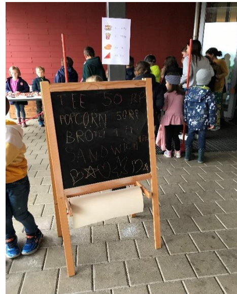
Grossandrang beim Pausenkiosk

vorbereitet. Da wird fleissig geschnitten, gestrichen, geformt und gebacken. Alle Kinder bekommen eine Aufgabe, und einige dürfen dann auch als Verkäuferinnen bzw. Verkäufer agieren – eine heiss begehrte Aufgabe.